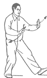
太極拳式示例： 「左攬雀尾」